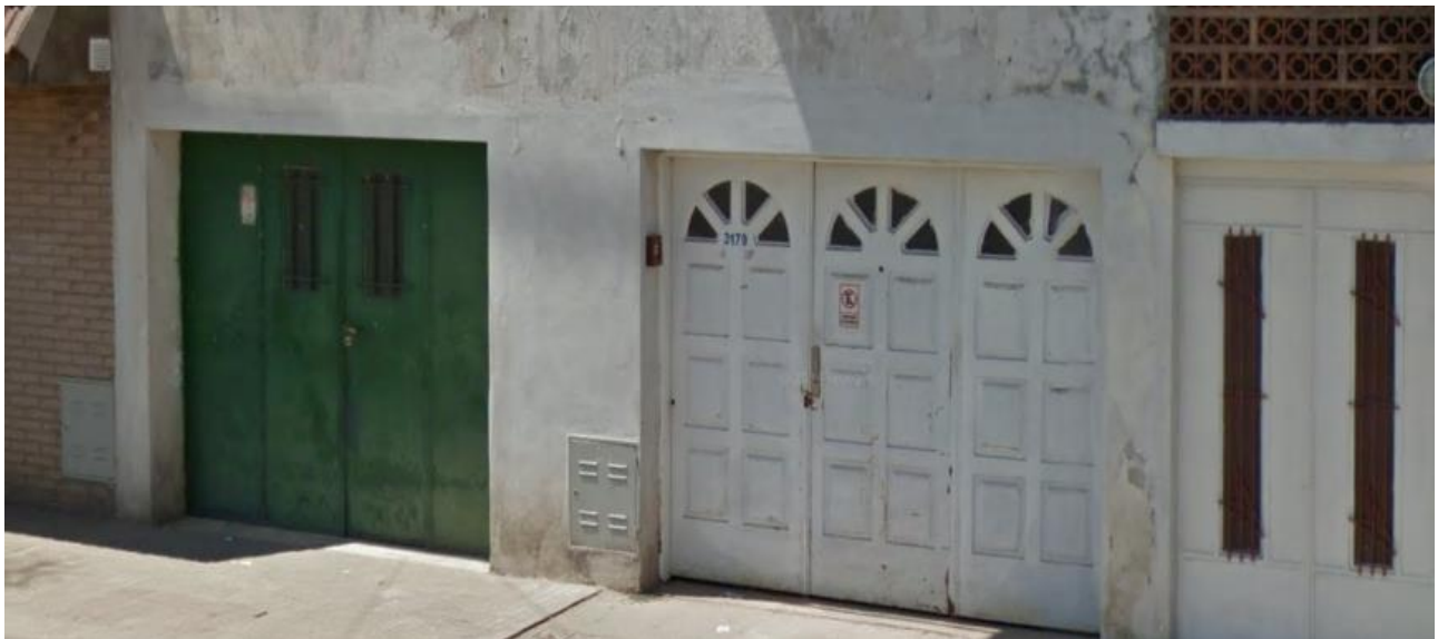
VISTA DEL LUGAR: CAMPBELL 3179.